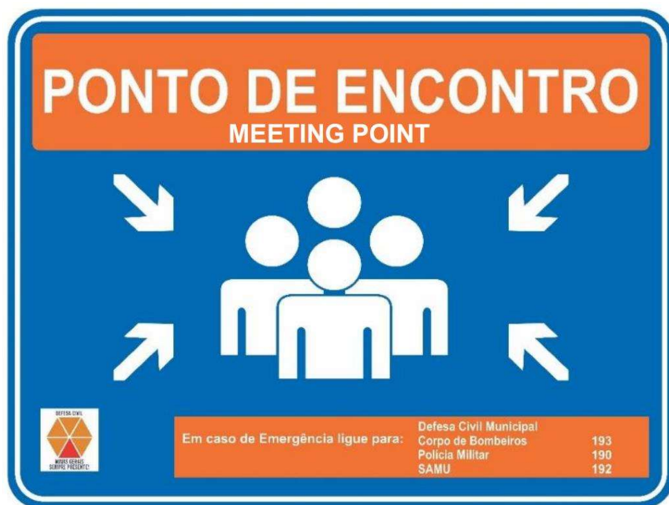
Figura 3 – Modelo de Placa de Ponto de Encontro.

Os pontos de encontro devem ser sinalizados com placas orientativas, dotadas de telefones úteis, em consonância com a IT 01/2021 da CEDEC-GMG, conforme modelo indicado na Figura 3.